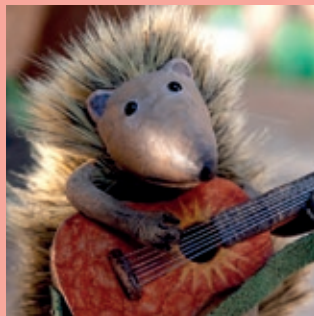
Une guitare à la mer.