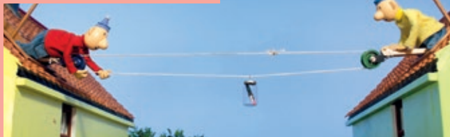
Pat et Mat, un dernier tour de vis.