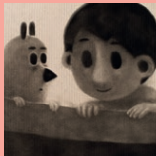
Les Bottes de la nuit.

UN SAMEDI PAR MOIS À 14H15 : des séances adaptées aux personnes en situation de handicap intellectuel, atteintes de troubles psychiques, d'autisme ou encore d'Alzheimer.