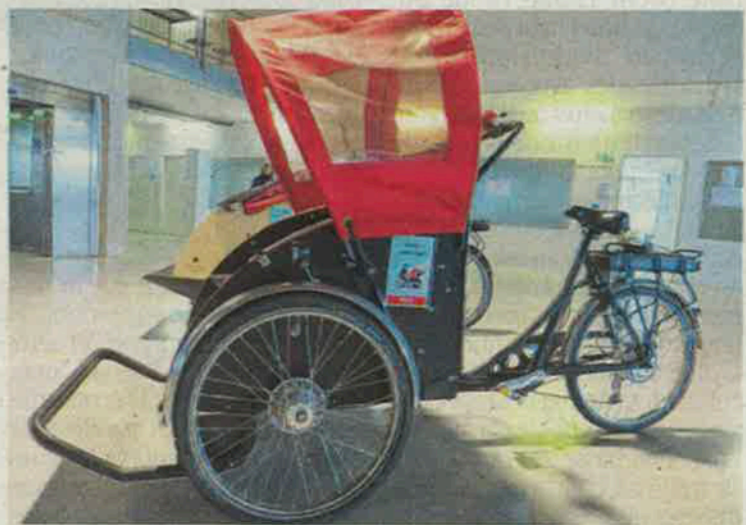
Une antenne de l'association A Vélo sans âge a été créée à Bordeaux en 2017 par des bénévoles membres de Vélo-Cité.

sont intéressés par ce projet. Un second Ehpad a rejoint en juin 2018 A Vélo sans âge. L'association ne pourra répondre aux demandes que si elle peut acquérir d'autres vélos et trouver des bénévoles pour les piloter; l'appel est lancé pour des animations se déroulent souvent